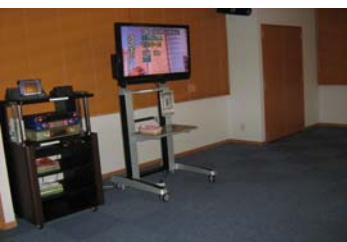
【娯楽室・カラオケ（2階）】