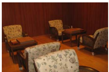
【娯楽室・囲碁・将棋（2階）】